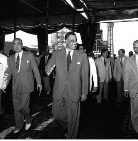
افتتاح خط أنابيب البترول بين القاهرة والسويس في مسطرد، ١٩٥٦/٧/٢٤.